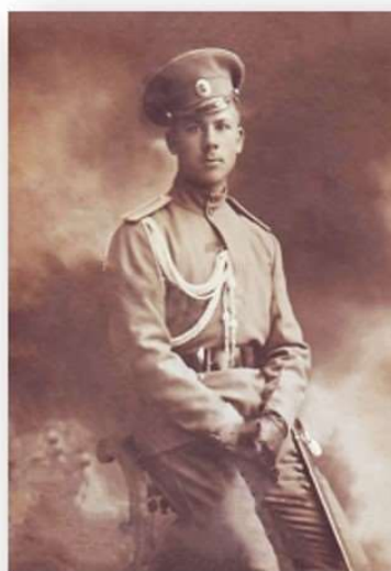
В. К. Котлинский, возглавивший контратаку 24 июля 1915 г.

Уровень седьмой (История). Здесь главное понять огромную разницу в понимании истории ариями и эрбинами. Для нас – это путь постижения промысла Божьего. Оттого мы стараемся на ошибках нашего прошлого учиться, делать верные выводы, дабы не повторять этих ошибок в будущем. Для них – это орудие манипуляции общественным сознанием. Поэтому