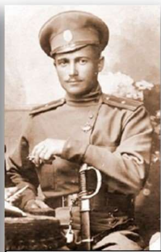
В. М. Стржеминский русский, польский и белорусский художник, авангардист, завершивший атаку мертвецов