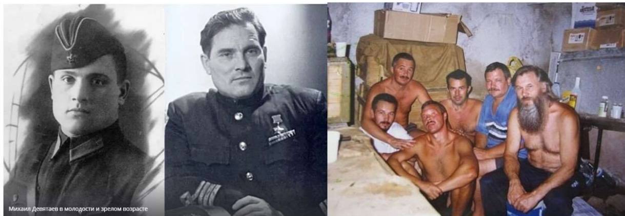
Лётчик Михаил Петрович Девятаев и достойные наследники его славы – члены экипажа самолёта Ил-76

И Девятаев, и члены экипажа российского самолёта Ил-76 были достойными потомками русских героев, совершивших до сих пор вызывающий изумление подвиг во время 1-й Мировой войны. Что лишний раз говорит о том, что код победы и великой жертвенности присущ самому народу. И никак не связан с формой государственности русских. Российская империя, Советский Союз, Современная Россия – какая разница? Для русских людей всё это просто разные названия того, что именуется словом Родина! И вот ради неё они и готовы жертвовать собой и добиваться победы в любых, самых сложных обстоятельствах.