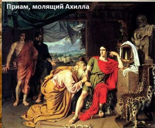
Приам, молящий Ахилла

Не мешало бы также вспомнить, с чего началась большая буза в греческом лагере перед финальными событиями Троянской войны. Два главных греческих героя, Агамемнон и Ахилл, не поделили женщину, некую Бризеиду, которую Ахилл заполучил в качестве трофея (только задумайтесь) после того, как захватил город Педас, в котором царствовал её отец (Брис/Борис), являвшийся главным жрецом Аполлона (а этот бог считался покровителем Гипербореи). При этом сын Пелея и nereиды (бессмертной) Фетиды убивает её мужа Минеса и трёх братьев! Да, действительно, Ахилл – мощный перец!