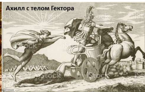
Ахилл с телом Гектора