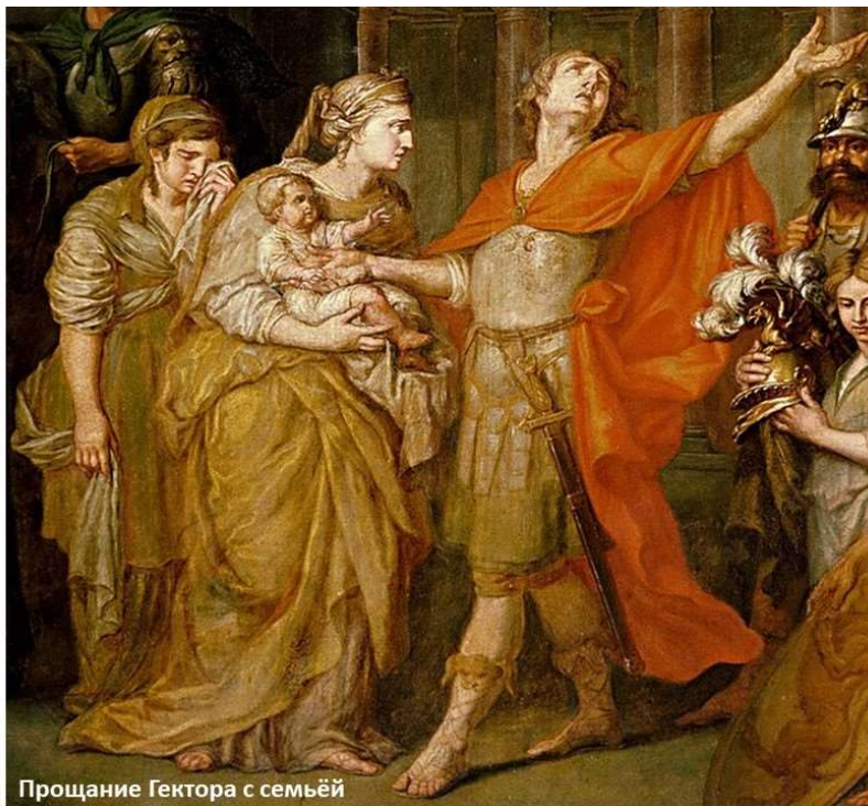
Прощание Гектора с семьёй