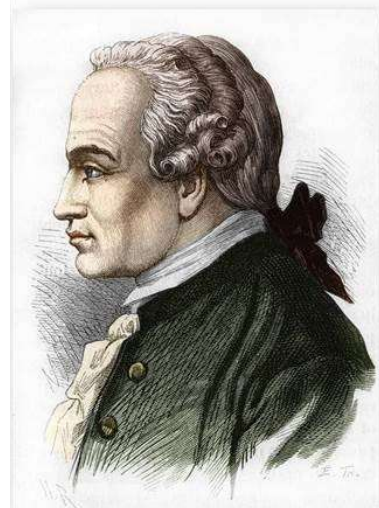
Иммануил Кант 22 апреля 1724, Кёнигсберг, Пруссия — 12 февраля 1804, там же) немецкий философ, родоначальник немецкой классической философии

Кант, конечно, молодец. Разваливающийся на его глазах мир религиозных догм он пытался удержать неким человеческим законом и человеческой моралью. Но тем самым он открыл