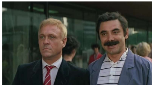
Эпилептоид Павел и психотимик Геннадий в фильме «Где захотится нофлет?», Мосфильм, 1987 год)

Главное отличие психотимика от эпилептоида заключается в том, что первый действует как бы по наваждению, руководствуясь в первую очередь своими чувствами, ведомый «божьем промыслом». Второй же опирается на доводы разума, логики и рационального. Классические примеры связок двух типов личности: Моцарт и Сальери, Карл Маркс и Фридрих Энгельс, Троцкий и Сталин, Черчилль и Чемберлен, Борис Березовский и Анатолий Чубайс. При этом не следует биться над решением вопроса, кто из них лучше и «более матери истории ценен». Каждый из них значим и исторически оправдан. Просто первые из них – психотимики, которые черпают свои идеи из бессознательного, через посредство которого как бы подключаются к естественному видению, слышанию и ощущению мира. Вторые, может быть, и лишены этого, но зато обладают неисчерпаемым талантом, упорством и последовательностью в достижении поставленных целей, что делает их совершенно незаменимыми в определенном историческом контексте.